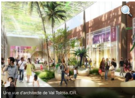
Une vue d'architecte de Val Tolosa.