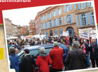
en chemin vers la préfecture nov. 2013

MANIF DES OPPOSANTS RECOURS AU TRIBUNAL administratif